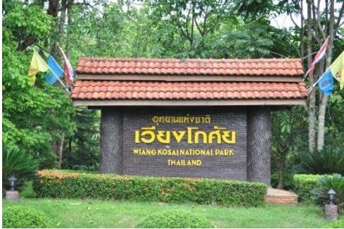
ภาพที่ ๖๕ ป้ายชื่ออุทยานแห่งชาติเวียงโกศัย

๑๒. อุทยานแห่งชาติเวียงโกศัย ต.แม่เก็ง อ.วังชิ้น จ.แพร่ พระเจ้าวรวงศ์เธอ พระองค์เจ้าโสมสวลี พระวรราชาทินัดดามาตุ ทรงปลูกต้นยมหิน เมื่อวันที่ ๔ กุมภาพันธ์ ๒๕๔๘