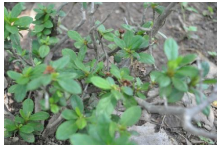
ภาพที่ ๓๕ ใบ