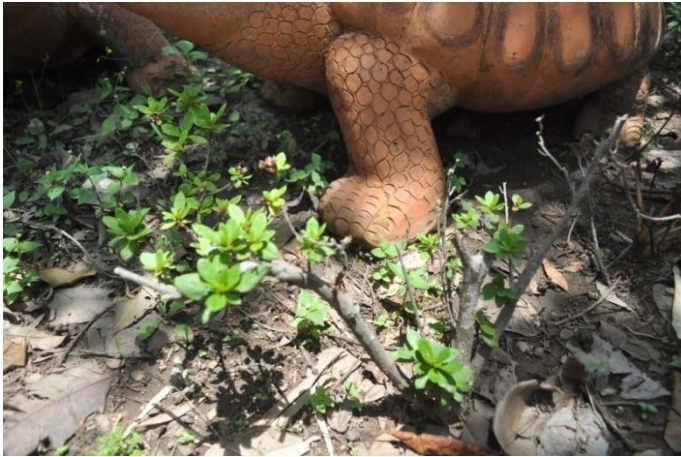
ภาพที่ ๓๒ ต้นและภูมิทัศน์รอบต้น

๕.๒.๑ กุหลาบพันปี (แดง) ปลูกเมื่อวันที่ ๑๕ ธันวาคม ๒๕๕๐