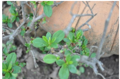
ภาพที่ ๔๐ ใบ

หมายเหตุ เนื่องจากต้นกุหลาบพันปี (แดง) ปลูกอยู่ใต้ต้นนางพญาเสือโคร่ง และรอบๆ มีต้นไม้ขนาดใหญ่เป็นจำนวนมาก ต้นกุหลาบพันปี (แดง) ไม่ได้รับแสงแดดพอเพียงในการสังเคราะห์แสง เจ้าหน้าที่อารักขาพันธุ์ไม้ป่า จึงได้แนะนำให้เจ้าหน้าที่ประจำสถานีพัฒนาฯ ตัดแต่งกิ่งต้นไม้บริเวณใกล้เคียงออก เพื่อให้แสงแดดส่องถึงต้นกุหลาบพันปี (แดง)