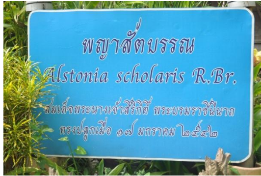
ภาพที่ ๒ ป้ายชื่อต้นไม้ และชื่อผู้ทรงปลูก