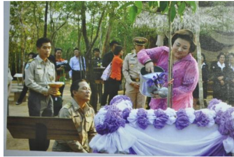
ภาพที่ ๕๖ ทรงปลูกต้นไม้ประจำปี