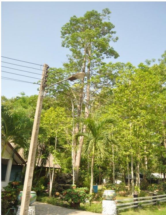
ภาพที่ ๔ ภูมิทัศน์รอบต้น