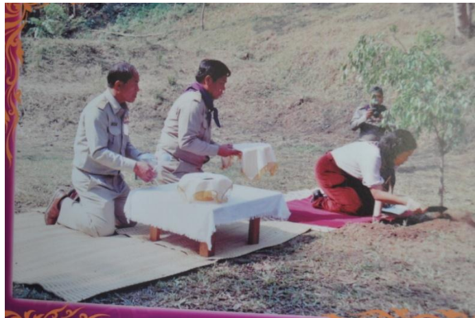
ภาพที่ ๔๕ ทรงปลูกต้นไทรย้อยใบแหลม