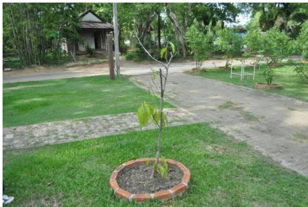
ภาพที่ ๕๗ ลำต้นและภูมิทัศน์รอบต้น