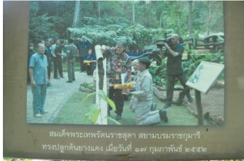
ภาพที่ ๑๘ ทรงปลูกต้นยางแดง

๓. ห้วยไฟ บ้านทุ่งกระเทียม ต.ภูซาง อ.ภูซาง จ.พะเยา สมเด็จพระเทพรัตนราชสุดาฯ สยามบรมราชกุมารี ทรงปลูกต้นยางแดง จำนวน ๑ ต้น เมื่อวันที่ ๑๗ กุมภาพันธ์ ๒๕๕๒