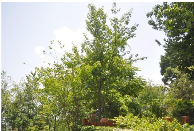
ภาพที่ ๓๐ ภูมิทัศน์รอบต้น