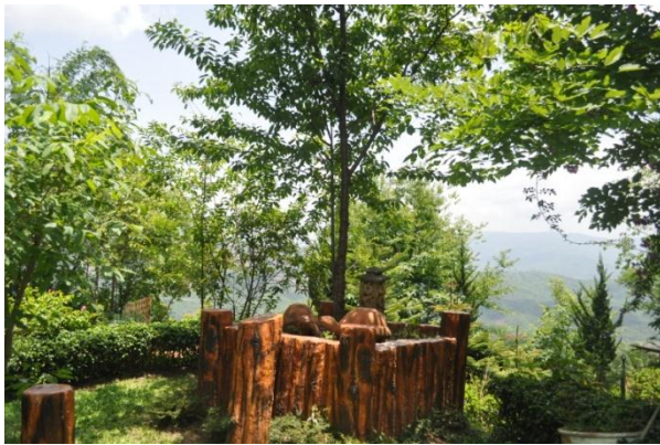
ภาพที่ ๒๘ ลำต้น