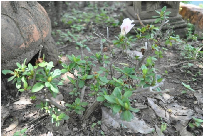
ภาพที่ ๓๔ ต้นและภูมิทัศน์รอบต้น

๕.๒.๒ กุหลาบพันปี (แดง) ปลูกเมื่อวันที่ ๑๕ ธันวาคม ๒๕๕๐