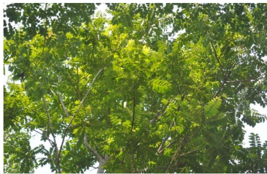
ภาพที่ ๕๔ ใบ

หมายเหตุ ป้ายชื่อต้นไม้ ชื่อผู้ทรงปลูก และเสารอบต้นไม้ตามแบบแปลน