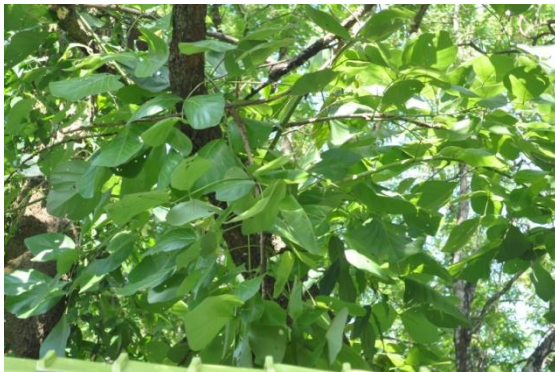
ภาพที่ ๑๑ ใบ