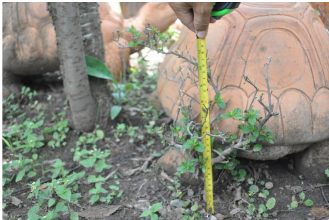
ภาพที่ ๓๙ ต้นและภูมิทัศน์รอบต้น

๕.๓ หม่อมหลวงสรลาลี กิติยากร ทรงปลูกต้นกุหลาบพันปี (แดง) จำนวน ๑ ต้น เมื่อวันที่ ๑๕ ธันวาคม ๒๕๕๐ เนื่องในโอกาสตรวจเยี่ยมราษฎรบริเวณพื้นที่สถานีพัฒนาการเกษตรที่สูงตาม พระราชดำริ บ้านห้วยห้วยกปากโซ อ.แม่ฟ้าหลวง จ.เชียงราย