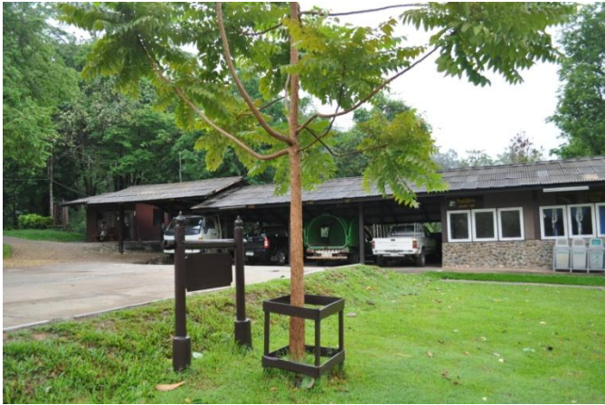
ภาพที่ ๖๗ ลำต้น