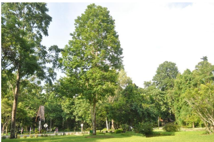
ภาพที่ ๑๖ ภูมิทัศน์รอบต้น