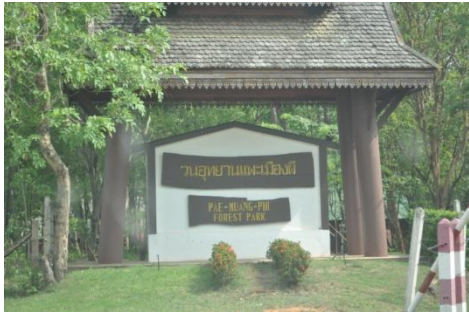
ภาพที่ ๕๕ ป้ายชื่อวนอุทยานแพะเมืองผี

๑๐. วนอุทยานแพะเมืองผี ต.น้ำชำ อ.เมือง จ.แพร่ พระเจ้าวรวงศ์เธอ พระองค์เจ้าโสมสวลี พระวรราชาทินัดดามาตุ ทรงปลูกต้นไม้ประจำปี เมื่อวันที่ ๒๔ มีนาคม ๒๕๕๔ เนื่องในโอกาสเสด็จเยี่ยมบ้ายพ่าย เป็นการส่วนพระองค์