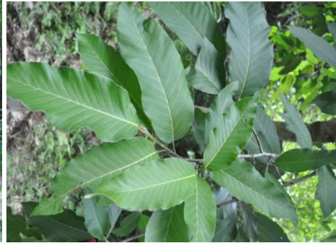
ภาพที่ ๒๐ ใบ