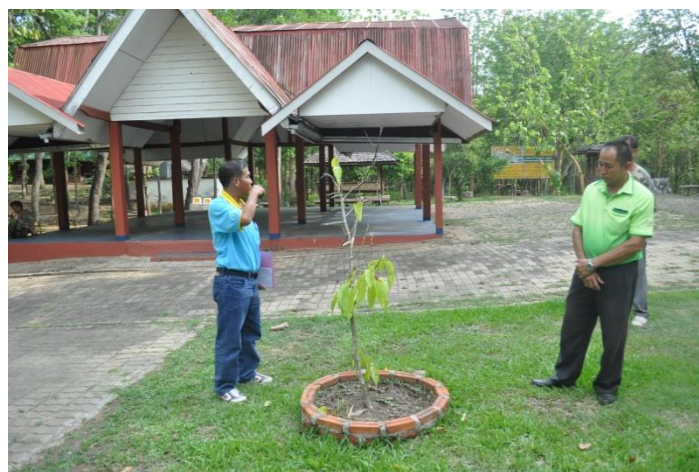
ภาพที่ ๕๙ เจ้าหน้าที่ฝ่ายอารักขาพันธุ์ไม้ป่า และเจ้าหน้าที่วนอุทยานแพะเมืองผี

หมายเหตุ เจ้าหน้าที่ฝ่ายอารักขาพันธุ์ไม้ป่าแนะนำเจ้าหน้าที่วนอุทยานแพะเมืองผี ให้ชุดล้อมต้นไม้มาอนุบาลให้แข็งแรงสมบูรณ์ดีแล้ว จึงนำปลูกใหม่ และให้จัดทำป้ายชื่อต้นไม้ ชื่อผู้ทรงปลูก และเสารอบต้นไม้ตามแบบแปลน