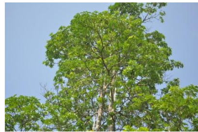
ภาพที่ ๕ ใบ