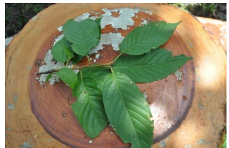
ภาพที่ ๓๑ ใบ