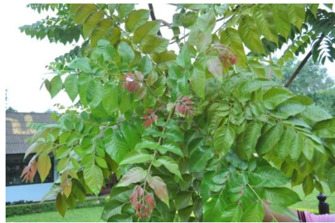
ภาพที่ ๖๘ ใบ