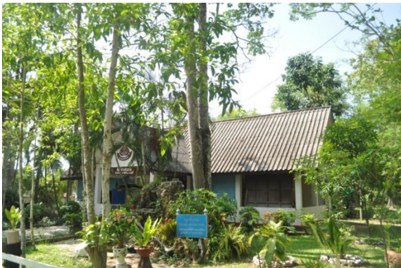
ภาพที่ ๓ ลำต้น