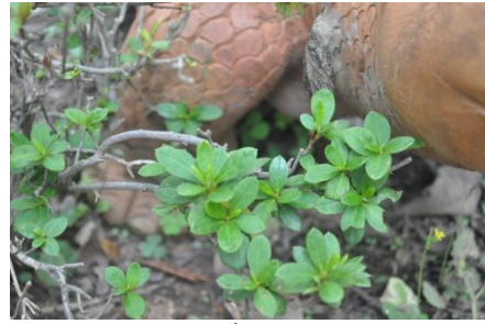
ภาพที่ ๓๘ ใบ

๕.๓ หม่อมหลวงสรลาลี กิติยากร ทรงปลูกต้นกุหลาบพันปี (แดง) จำนวน ๑ ต้น เมื่อวันที่ ๑๕ ธันวาคม ๒๕๕๐ เนื่องในโอกาสตรวจเยี่ยมราษฎรบริเวณพื้นที่สถานีพัฒนาการเกษตรที่สูงตาม พระราชดำริ บ้านห้วยห้วยกปากโซ อ.แม่ฟ้าหลวง จ.เชียงราย