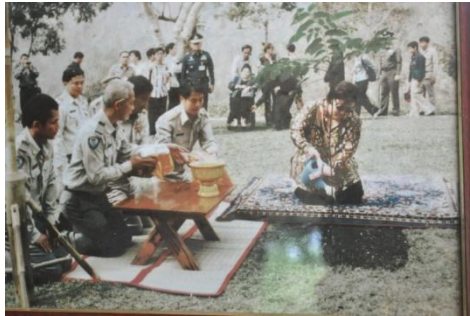
ภาพที่ ๕๑ ทรงปลูกต้นยมหิน