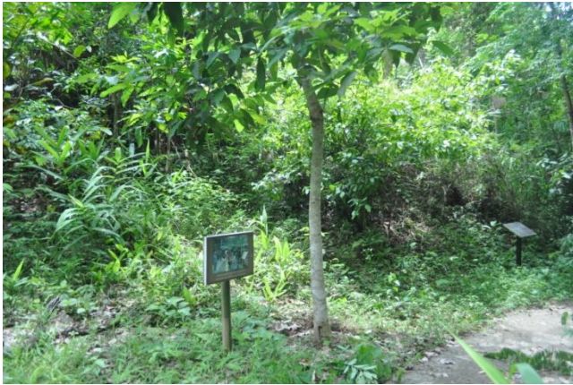
ภาพที่ ๑๙ ลำต้น