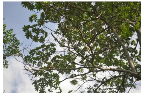
ภาพที่ ๖ กิ่งแห้ง