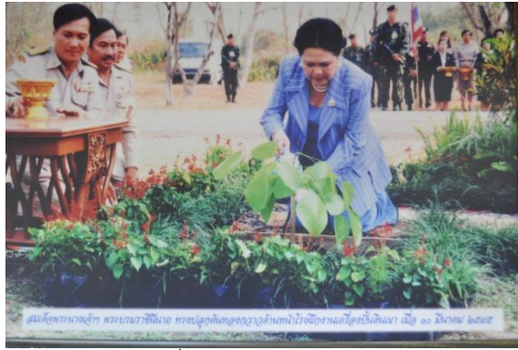
ภาพที่ 8 ทรงปลูกต้นทองกวาว