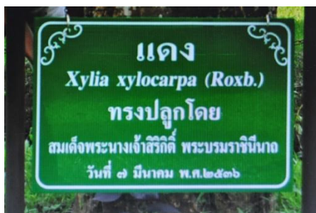
ภาพที่ ๑๓ ป้ายชื่อต้นไม้และผู้ทรงปลูก

๒. อุทยานแห่งชาติแจ้ซ้อน ตำบลแจ้ซ้อน อำเภอเมืองปาน จังหวัดลำปาง สมเด็จพระนางเจ้าฯ พระบรมราชินีนาถ ทรงปลูกต้นแดง จำนวน ๑ ต้น