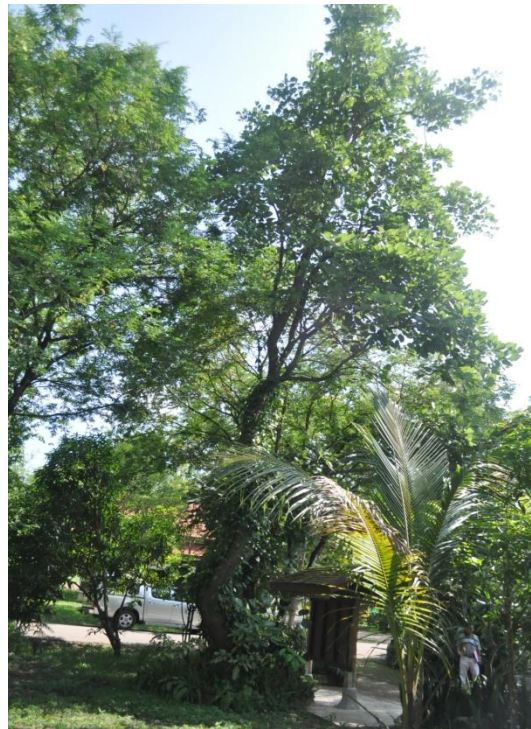
ภาพที่ ๑๒ ภูมิทัศน์รอบต้น

หมายเหตุ เจ้าหน้าที่ฝ่ายอารักขาพันธุ์ไม้ป่า ได้แนะนำเจ้าหน้าที่โครงการพระราชดำริฯ บ้านทุ่งจี้ ตัดแต่งเถาต้นดีปรีออกเป็นบางส่วน