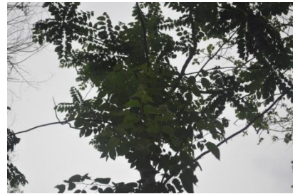
ภาพที่ ๖๓ ใบ