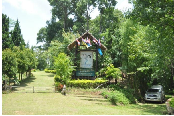
ภาพที่ ๒๗ ป้ายชื่อโครงการฯ

๕.๑ สมเด็จพระนางเจ้าฯ พระบรมราชินีนาถ ทรงปลูกต้นนางพญาเสือโคร่ง จำนวน ๑ ต้น เมื่อวันที่ ๒๑ มีนาคม ๒๕๕๙ เนื่องในโอกาสเปิดสถานีพัฒนาการเกษตรที่สูง ตามพระราชดำริ