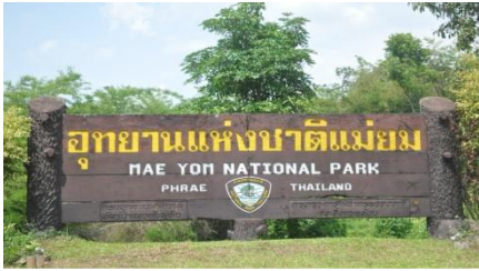
ภาพที่ ๕๐ ป้ายชื่ออุทยานแห่งชาติแม่ยม

๙. อุทยานแห่งชาติแม่ยม ต.สะเอียบ อ.สอง จ.แพร่ พระเจ้าวรวงศ์เธอ พระองค์เจ้าโสมสวลี พระวรราชทินนิตตามาตุ ทรงปลูกต้นยมหิน จำนวน ๑ ต้น เมื่อวันที่ ๔ กุมภาพันธ์ ๒๕๔๘