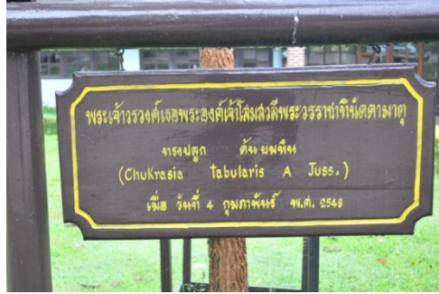
ภาพที่ ๖๖ ป้ายชื่อผู้ทรงปลูกและชื่อต้นไม้