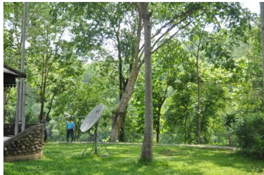
ภาพที่ ๕๒ ลำต้น