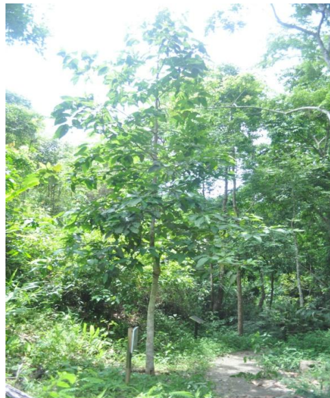
ภาพที่ ๒๑ ภูมิทัศน์รอบต้น

หมายเหตุ เจ้าหน้าที่ฝ่ายอารักขาพันธุ์ไม้ป่า แนะนำให้จัดทำป้ายชื่อผู้ทรงปลูก ชื่อต้นไม้ และเสารอบต้นไม้ ตามแบบแปลน