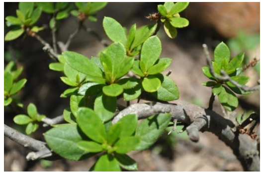
ภาพที่ ๓๓ ใบ

๕.๒.๒ กุหลาบพันปี (แดง) ปลูกเมื่อวันที่ ๑๕ ธันวาคม ๒๕๕๐