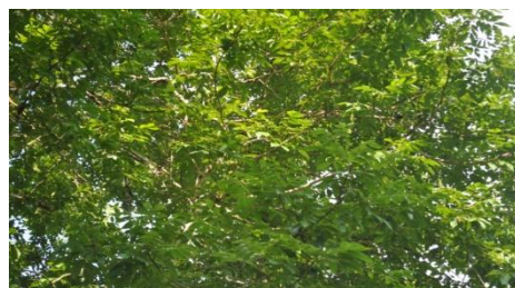
ภาพที่ 17 ใบ

หมายเหตุ เจ้าหน้าที่ฝ่ายอารักขาพันธุ์ไม้ป่า แนะนำให้จัดทำป้ายชื่อผู้ทรงปลูก ชื่อต้นไม้ และเสารอบต้นไม้ตามแบบแปลน