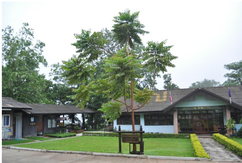
ภาพที่ ๖๙ ภูมิทัศน์รอบต้น

หมายเหตุ เจ้าหน้าที่ฝ่ายอารักขาพันธุ์ไม้ป่า แนะนำให้จัดทำป้ายชื่อผู้ทรงปลูก ชื่อต้นไม้ และเสารอบต้นไม้ ตามแบบแปลน