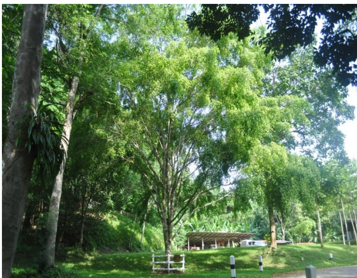
ภาพที่ ๔๘ ภูมิทัศน์รอบต้น

หมายเหตุ เจ้าหน้าที่ฝ่ายอารักขาพันธุ์ไม้ป่า แนะนำให้จัดทำป้ายชื่อผู้ทรงปลูก ชื่อต้นไม้ และเสารอบต้นไม้ ตามแบบแปลน