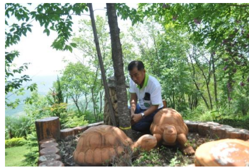
ภาพที่ ๒๙ เจ้าหน้าที่ฯ วัดขนาดต้นไม้