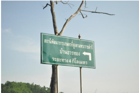
ภาพที่ ๔๑ ป้ายไปสถานีพัฒนาฯ

๖. สถานีพัฒนาการเกษตรที่สูง ตามพระราชดำริ บ้านธารทอง อ.แม่ฟ้าหลวง จ.เชียงราย มีต้นไม้ทรงปลูก จำนวน ๒ ต้น