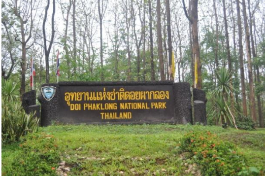
ภาพที่ ๖๐ ป้ายชื่ออุทยานแห่งชาติดอยผาหลวง

๑๑. อุทยานแห่งชาติดอยผาหลวง ต.ต้าผาหลวง อ.ลอง จ.แพร่ พระเจ้าวรวงศ์เธอ พระองค์เจ้าโสมสวลี พระวรราชาทินัดดามาตุ ทรงปลูกต้นยมหิน เมื่อวันที่ ๔ กุมภาพันธ์ ๒๕๔๘