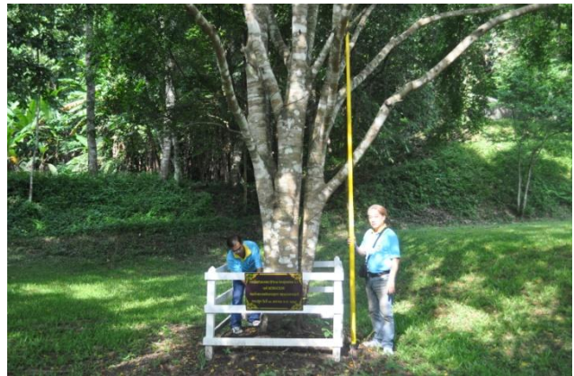
ภาพที่ ๔๗ เจ้าหน้าที่กำลังวัดโต สูง และทรงพุ่ม