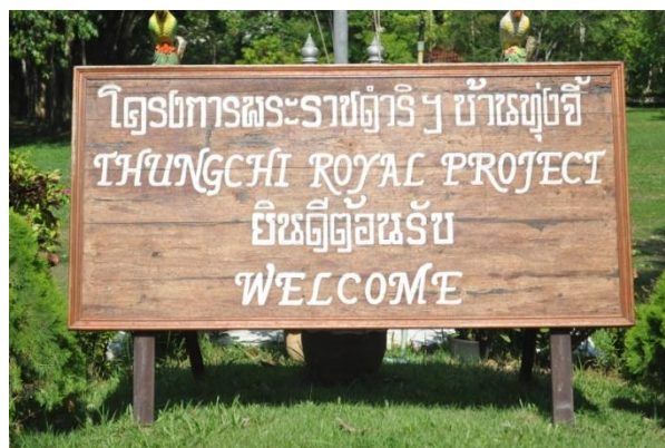
ภาพที่ ๑ ป้ายชื่อโครงการพระราชดำริฯ บ้านทุ่งจี้

๑.๑ สมเด็จพระนางเจ้าฯ พระบรมราชินีนาถ ทรงปลูกต้นพญาสัตบรรณ เมื่อวันที่ ๑๗ มกราคม ๒๕๕๒ เนื่องในโอกาสเปิดโรงฝึกงานเครื่องปั้นดินเผา