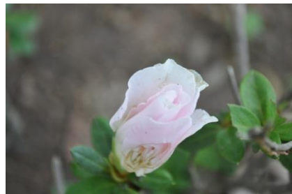
ภาพที่ ๓๖ ดอก