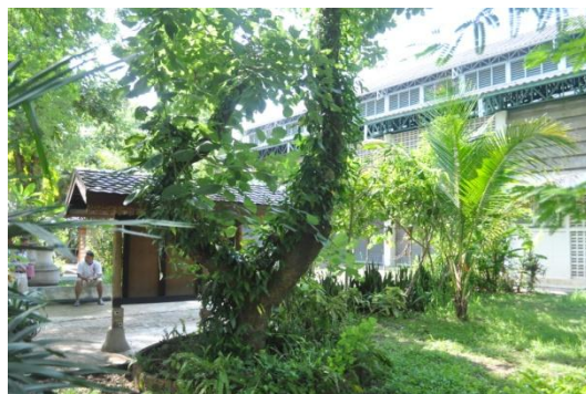
ภาพที่ ๑๐ ลำต้น