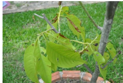
ภาพที่ ๕๘ ใบ