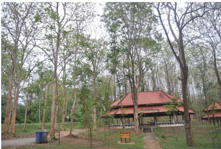
ภาพที่ ๖๔ ภูมิทัศน์รอบต้น

หมายเหตุ เจ้าหน้าที่ฝ่ายอารักขาพันธุ์ไม้ป่า ให้จัดทำป้ายชื่อผู้ทรงปลูก ชื่อต้นไม้ และเสารอบต้นไม้ ตามแบบแปลน