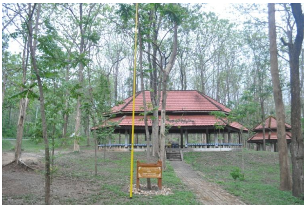
ภาพที่ ๖๒ ลำต้น