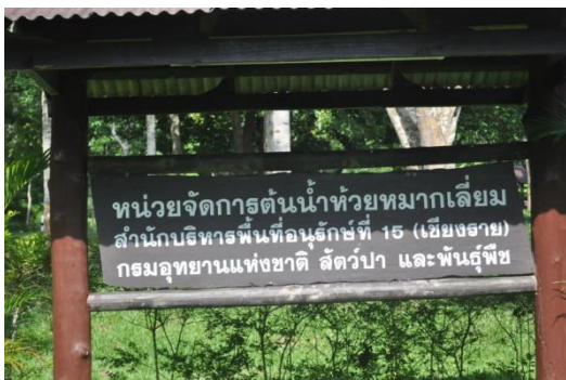
ภาพที่ ๔๓ ป้ายชื่อหน่วยจัดการต้นน้ำห้วยหมากเหลี่ยม

๘. หน่วยจัดการต้นน้ำห้วยหมากเหลี่ยม ต.ดอยฮาง อ.แม่สรวย จ.เชียงราย สมเด็จพระเทพรัตนราชสุดาฯ สยามบรมราชกุมารี ทรงปลูกต้นไทรย้อยใบแหลม จำนวน ๑ ต้น เมื่อวันที่ ๓๑ มกราคม ๒๕๓๘