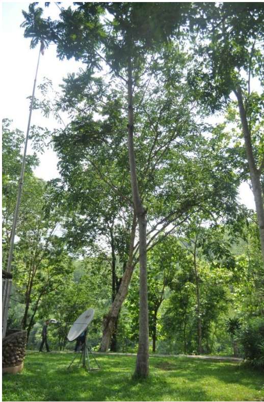
ภาพที่ ๕๓ ภูมิทัศน์รอบต้น