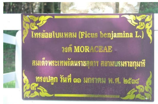
ภาพที่ ๔๔ ป้ายชื่อต้นไม้และผู้ทรงปลูก