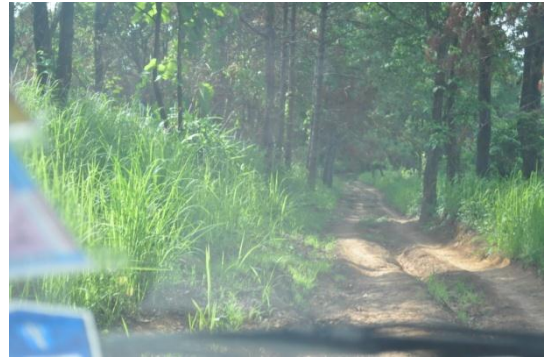
ภาพที่ ๔๒ ถนนไปสถานีพัฒนาฯ

หมายเหตุ ภาพที่ ๔๑ และ ๔๒ เจ้าหน้าที่ฝ่ายอารักขาพันธุ์ไม้ป่า ไม่สามารถเดินไปถึงสถานีพัฒนาเกษตรที่สูง ตามพระราชดำริได้ เนื่องจากเป็นทางทุรกันดารถนนเป็นร่องลึกสูงชันและมีก้อนหินขนาดใหญ่ในการเดินทางขึ้นไปให้ถึงสถานีฯ ต้องใช้รถขับเคลื่อนสี่ล้อในการเดินทาง