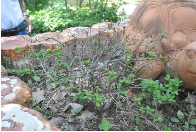
ภาพที่ ๓๗ ต้นและภูมิทัศน์รอบต้น

๕.๓ หม่อมเจ้าพันธุ์สวลี กิติยากร ทรงปลูกต้นกุหลาบพันปี (แดง) จำนวน ๑ ต้น เมื่อวันที่ ๑๕ ธันวาคม ๒๕๕๐ เนื่องในโอกาสตรวจเยี่ยมราษฎรบริเวณพื้นที่สถานีพัฒนาการเกษตรที่สูงตาม พระราชดำริ บ้านห้วยห้วยกปากโซ อ.แม่ฟ้าหลวง จ.เชียงราย