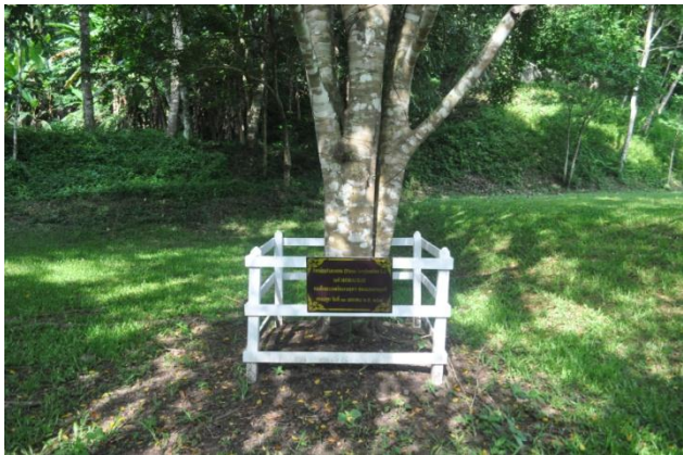
ภาพที่ ๔๖ ลำต้น ป้ายชื่อและคอกล้อมต้นไม้