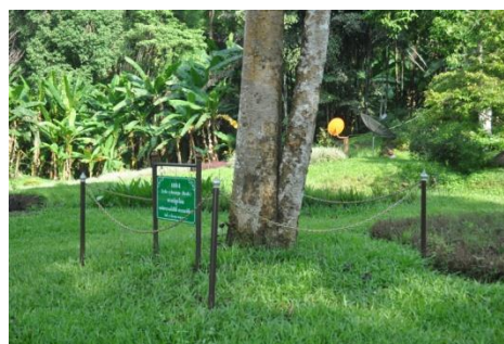
ภาพที่ ๑๕ ป้ายชื่อต้นไม้และเสารอบต้น