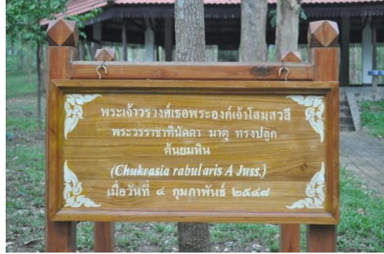
ภาพที่ ๖๑ ป้ายชื่อผู้ปลูกและชื่อต้นไม้