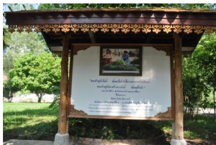
ภาพที่ ๙ ป้ายชื่อต้นไม้และผ้าทรงปลูก