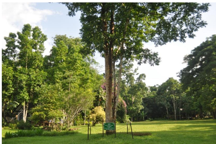
ภาพที่ ๑๔ ลำต้น